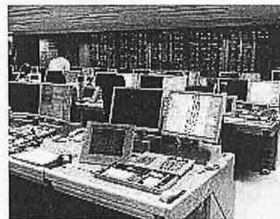
高機能消防指令センター

119番等の災害通報に対し、 ○消防車や救急車の動態に基づく出動隊の自動選定 ○通報場所の検索 などが可能で、的確な消防指令業務を行う。 （補助率：1/3）